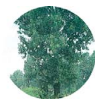
Pioppo bianco ( Populus alba )