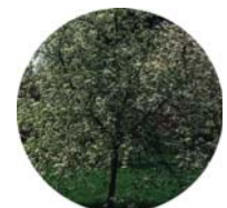
Ciliegio canino ( Prunus mahaleb )