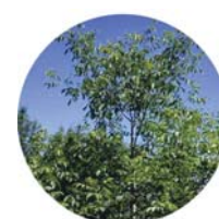
Noce domestico ( Juglans regia )