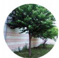
Ciliegio selvatico ( Prunus avium )