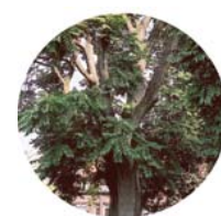
Frassino meridionale ( Fraxinus angustifolia )