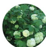
Palla di neve ( Viburnum opulus )