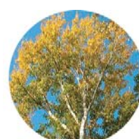
Pioppo grigio ( Populus canescens )