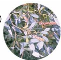
Salice bianco ( Salix alba )