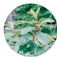
Frangola ( Frangula alnus )