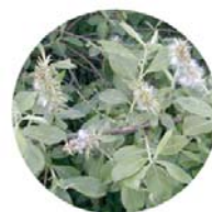
Salice grigio ( Salix cinerea )