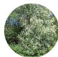
Pado ( Prunus padus )