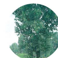
Pioppo bianco ( Populus alba )