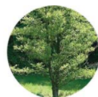
Ontano nero ( Alnus glutinosa )