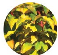
Sanguinello ( Cornus sanguinea )