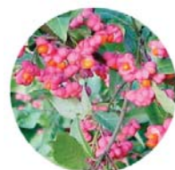
Evonimo ( Euonymus europaeus )