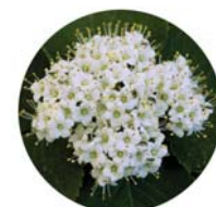
Lantana ( Viburnum lantana )