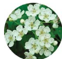
Biancospino ( Crataegus monogyna )