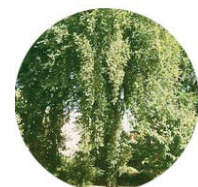
Olmo campestre ( Ulmus campestris )