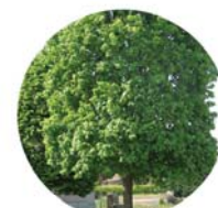
Acero campestre ( Acer campestre )