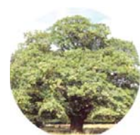
Quercia farnia ( Quercus robur )