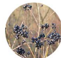
Ligustro ( Ligustrum vulgare )