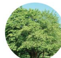
Carpino bianco ( Carpinus betulus )