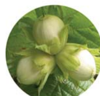
Nocciolo ( Corylus avellana )