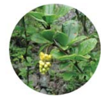
Crespino (Berberis vulgaris)