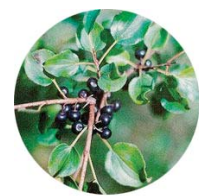
Spino cervino (Rhamnus catharticus)