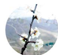
Prugnolo (Prunus spinosa)