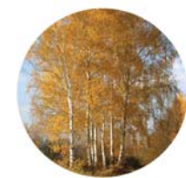
Betulla (Betula alba)