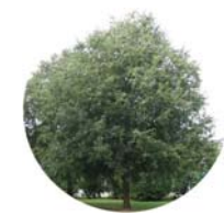
Bagolaro (Celtis australis)