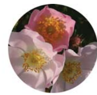
Rosa canina (Rosa canina)