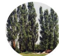
Pioppo tremolo (Populus tremula)