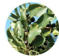
Corniolo (Cornus mas)